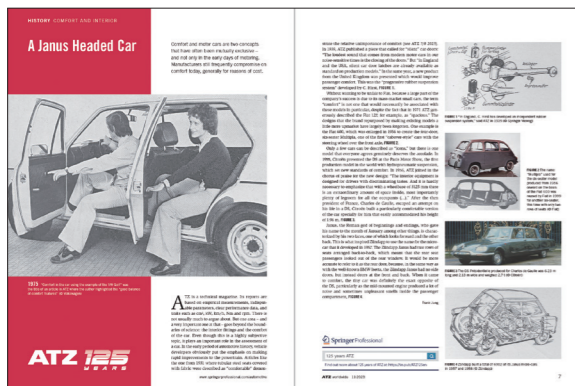
1975年 ATZ「VWゴルフを例としたクルマの快適性」の記事

ATZは、今年で創刊126年を迎えました。創刊以来、常に最新の技術やトレンドを追求し、世界的な自動車技術と科学の進歩を支える役割を果たしてきました。現代では、最も信頼できる情報源として、自動車業界をはじめ技術、経済、社会科学などの幅広い分野で不可欠な存在となっています。また、読者、ユーザー、広告主向けに、デジタルプラットフォーム、雑誌、書籍を編集・出版し、国際会議などのイベントも開催しています。