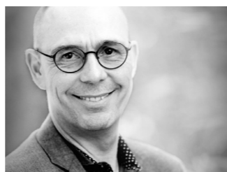
ATZ 編集長 アレクサンダー・ハインツェル博士

ATZは、技術志向の経営層の皆様の圧倒的な支持を得て、自動車・自動車部品業界、自動車販売会社、および世界各地の研究・開発機関の間で、自動車開発分野におけるグローバルでホットな情報伝達やコミュニケーションを促進しています。